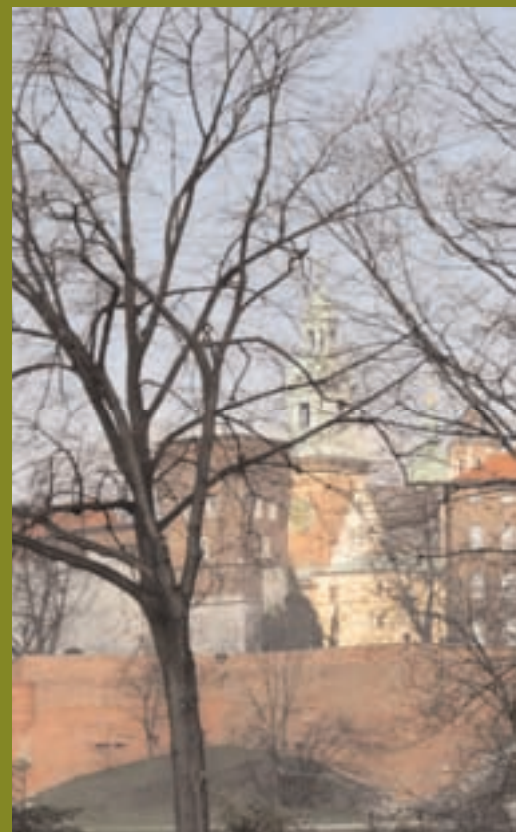
DE LA RIVE DROITE, UNE VUE SUR LE MUR D'ENCEINTE DU CHÂTEAU DE WAWEL, QUI DOMINE LA VISTULE.