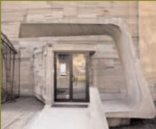
BUNKIER SZTUKI : EXEMPLE DU BRUTALISME DES ANNÉES SOIXANTE.