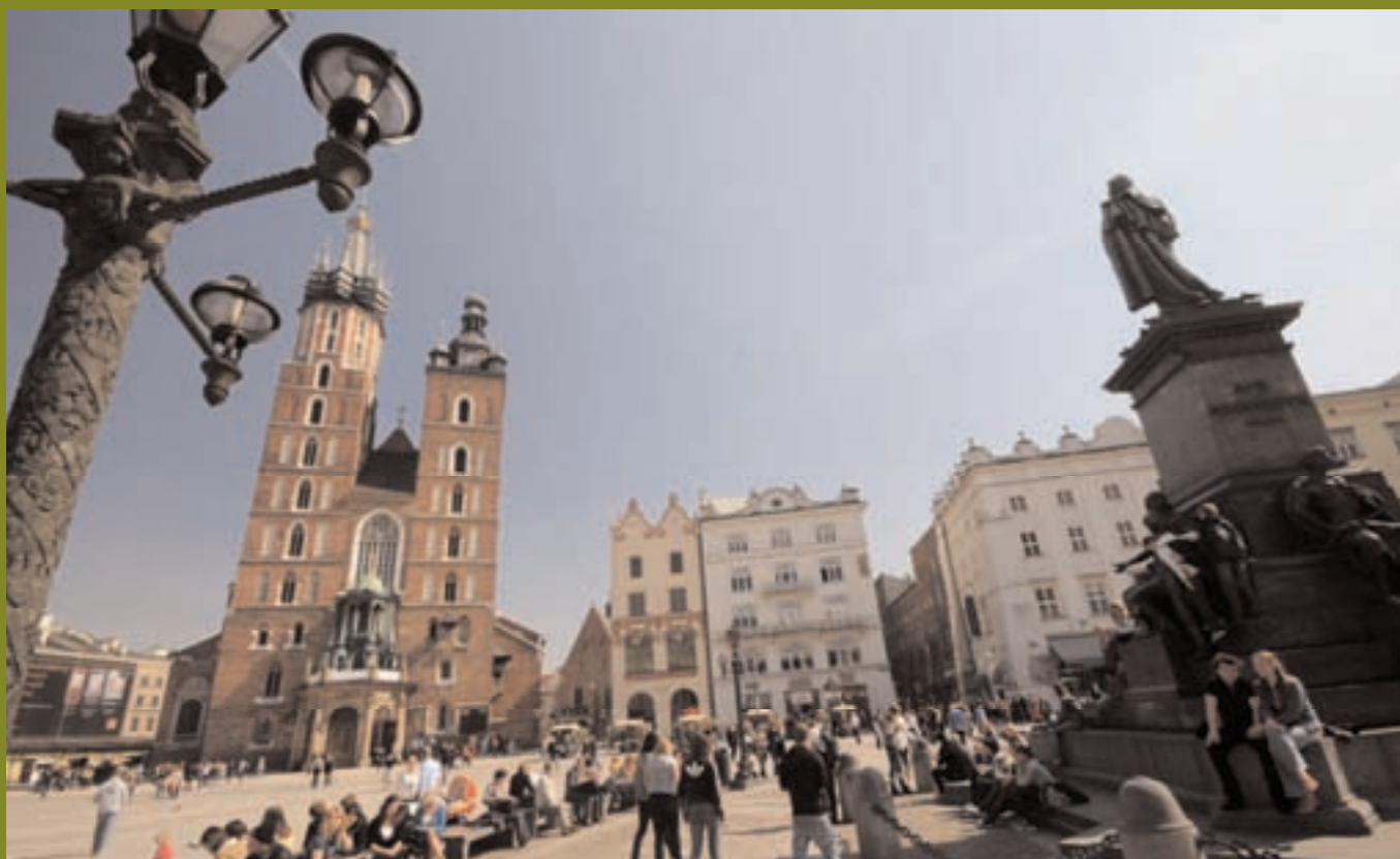
VUE DU RYNEK, GRANDE PLACE DU MARCHÉ, CÔTÉ NOTRE-DAME.