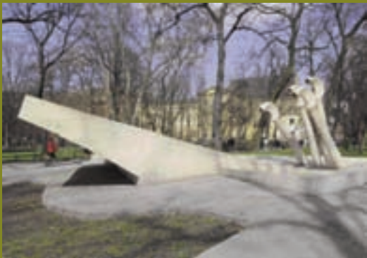
SOUS LES ARBRES DES PLANTY, LE MONUMENT CHOPIN PAR MARIA JAREMA.