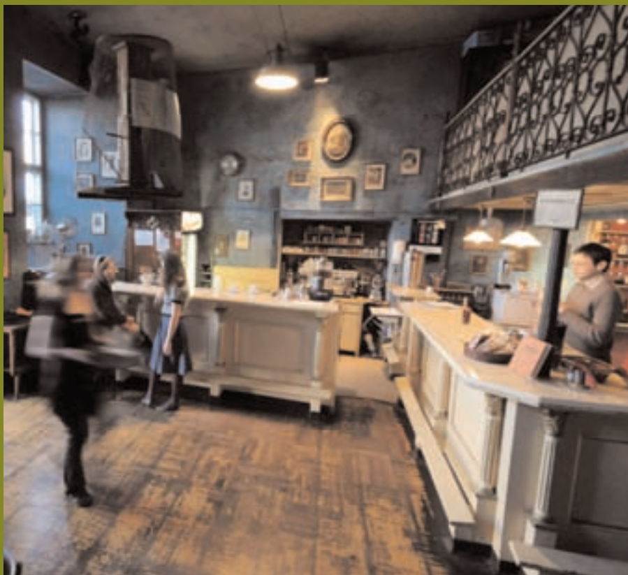
LE CAFÉ BUNKIER RESPIRE L'ESPRIT CRACOVIENT.