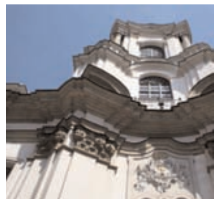
BAROQUE CRACOVIENT : ENCHEVÊTREMENT DES CORNICHES DE L'ÉGLISE DES FRÈRES HOSPITALIERS DE SAINT-JEAN-DE-DIEU.

scène un piano à queue béant dont les marteaux giclent des cordes aquatiques. Si vous ne cédez pas à la tentation d'un des bancs de ce jardin, devant l'œuvre de l'une des plus percutantes personnalités de l'art abstrait en Europe centrale, l'allée des Planty mène tout droit vers la colline de Wawel. La cathédrale et le château royal couronnent ce lieu magique, véritable réceptacle de l'histoire polonaise mais aussi de ses légendes et mythes. Face au château, de l'autre côté de la Vistule, le musée de l'Art et de la Technique japonais Manggha. Le bâtiment, conçu par Arata Isozaki et inauguré en 1994, ondule au milieu de la verdure, et ses formes minérales semblent se superposer aux vagues du fleuve. Le musée accueille une remarquable collection d'art japonais que Feliks Jasienski, dit Manggha, a rassemblée au tournant du XIX e siècle. Créé à l'initiative du réalisateur Andrzej Wajda, un inconditionnel de la culture nipponne, le musée