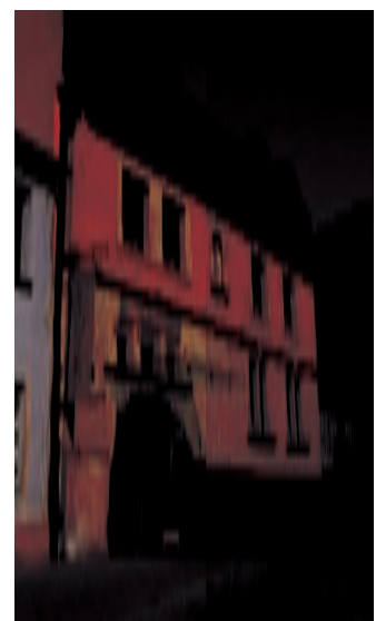
L'HÔTEL GRODEK DONNE SUR LES JARDINS DES PLANTY : CALME ET CONFORT À QUELQUES PAS DU RYNEK.

Pologne. Wróblewski élabore un langage figuratif à la forme dense, au coloris résolu, à l'émotion tendue. Plusieurs de ses toiles se trouvent dans la collection de Zderzak et au Musée national de Cracovie. Reprenons le sillon vert des Planty dans la direction de la rue Karmelicka, voie animée qui traverse le quartier de Piasek. Depuis 2007, la galerie Foto-Medium-Art s'y est installée, après trente années d'activités à Wrocław, capitale de la Silésie. Dirigée par Jerzy Olek, photographe lui-même, et Krzysztof Siatka, la galerie se spécialise dans l'avant-garde de la photographie polonaise et internationale depuis les années soixante-dix. Parmi les artistes exposés sur les murs de Foto-Medium-Art comptent Darboven, Rosenbach, Kosuth, Boltansky, Hartwig et la collaboration permanente est établie avec Berdyszak, Codemanipulator, Dunikowski-Duniko, Jakubowicz et Natalia LL. À travers leurs œuvres, Foto-Medium-Art recherche tout particulièrement les liens entre la photographie et le film, la vidéo, l'architecture, la musique, les nouvelles technologies et théories de culture. Piasek, c'est également