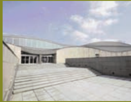
LE BÂTIMENT DE MANGGHA, PAR ARATA ISOZAKI, FAIT RÉFÉRENCE AU MOTIF DE LA GRANDE VAGUE D'HOKUSAI.