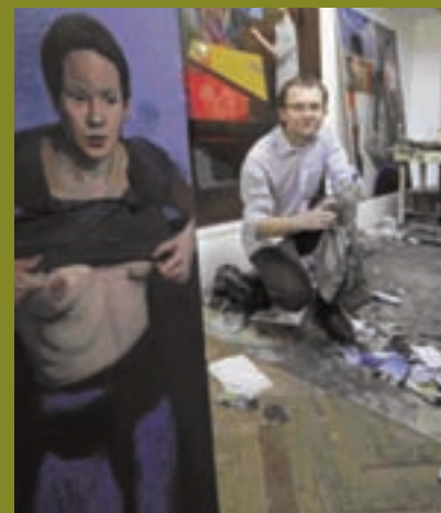
ATELIER DE GRZEGORZ WNEK. SA PEINTURE EST DIRECTE, LA COMPOSITION DENSE, LE MESSAGE TENDU.