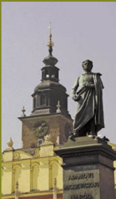
LE RYNEK ET SES ACTEURS : MONUMENT ADAM MICKIEWICZ, HALLES AUX DRAPS, BEFFROI DE L'HÔTEL DE VILLE.